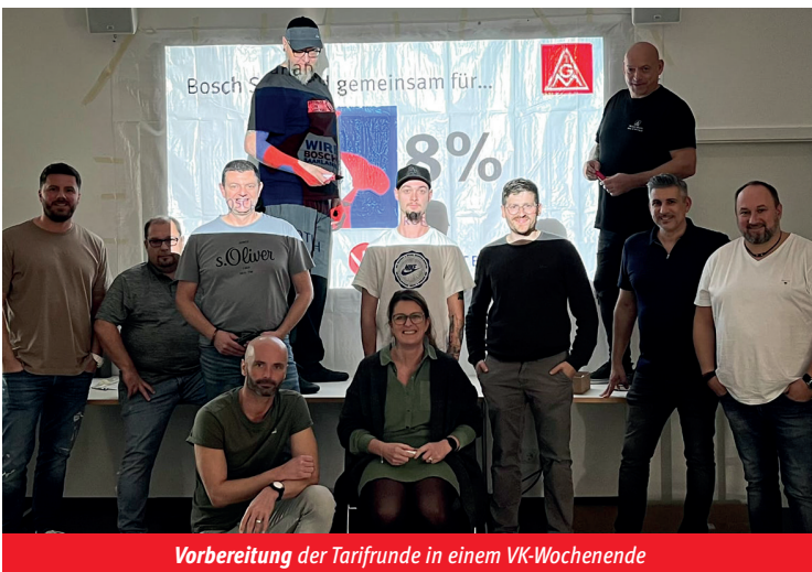
Vorbereitung der Tarifrunde in einem VK-Wochenende