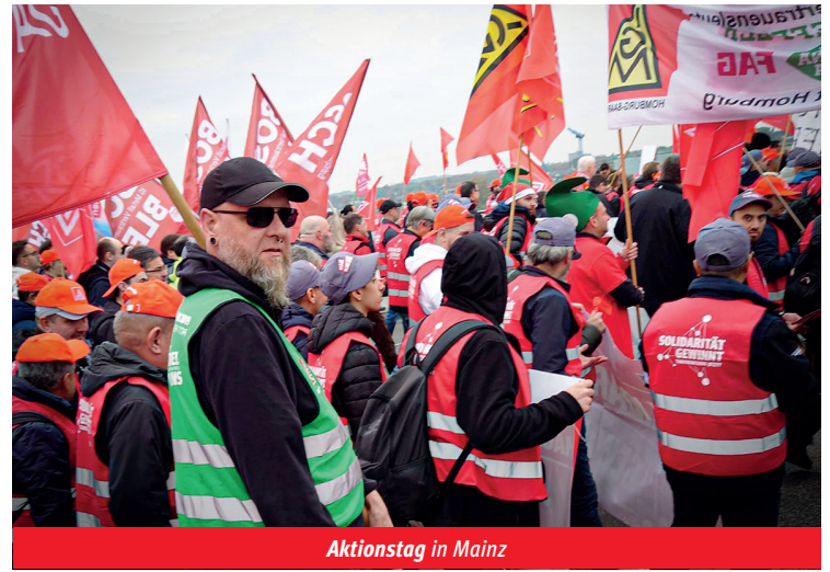
Aktionstag in Mainz