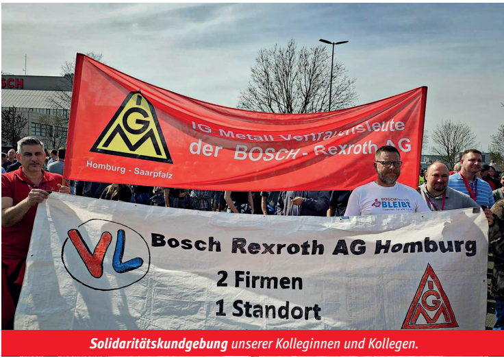
Solidaritätskundgebung unserer Kolleginnen und Kollegen.